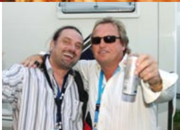
A.C. BRAUN MIT MARK KING (LEVEL 42)