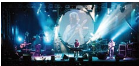
OFF THE WALL: THE SPIRIT OF PINK FLOYD

Fr, 3.10., Obertraubling, Mehrzweckhalle, 20.00 Uhr