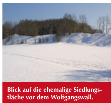
Blick auf die ehemalige Siedlungsfläche vor dem Wolfgangswall.