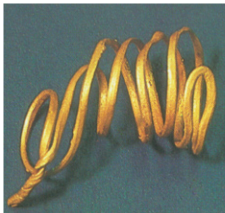
Goldener Lockenring vom Frauenberg