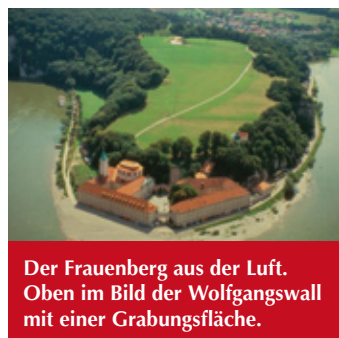
Der Frauenberg aus der Luft. Oben im Bild der Wolfgangswall mit einer Grabungsfläche.

In der Frühbronzezeit entstand dort die erste größere Siedlung. Herausragende Fundstücke, z.B. ein goldener Lockenring, ein Brotlaibidol, mehrere Trensenknebel aus Geweih und Merkmale an der Keramik belegen einen regen Austausch mit anderen frühbronzezeitlichen Kulturgruppen bis in über 400 Kilometer Entfernung. Da die Siedlung unbefestigt war, lässt sich friedlicher interkultureller Austausch vermuten. In der mittleren Urnenfelderzeit begann man mit dem Bau von zwei Befesti-