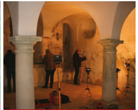
Ausgrabung in der Frauenbergkirche 2004

gungsanlagen. Diese beiden Abschnittswälle, von denen der längste immerhin 1,2 Kilometer lang ist, sind heute noch im Gelände sichtbar. Mindestens zwei Zerstörungshorizonte einer frühen Stein- und einer späteren Holzbefestigung belegen kriegerische Auseinandersetzungen, die darauf hindeuten, dass der Frauenberg als Zufluchtsort in unruhigen Zeiten genutzt wurde. Nach der Zerstörung der Anlage entstanden dort in der Zeit zwischen 900 und 800 v. Chr. drei späturnfelderzeitliche Höfe, deren Areale von ca. 60 x 60 m hohen Palisadenwänden aus Holzstämmen umzäunt waren. Danach wurde das Plateau erst in der Frühlatènezeit zwischen 500 und 400 v. Chr. wieder besiedelt. Die Kelten hinterließen zahlreiche große Siedlungsgruben mit Keramikscherven, Tierknochen und Bronzeschmuck sowie wenige Bestattungen.