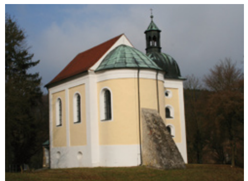
Blick auf die heutige Frauenbergkirche.

Bis vor kurzem ging man davon aus, dass das Plateau in spätrömischer Zeit militärisch genutzt wurde. Jüngste Ausgrabungen in und um die Frauenbergkirche waren Anlass diese Interpretation einer älteren Grabung in Frage zu stellen, denn das Steingebäude oben auf dem Plateau ist zeitgleich mit einem Monumentalbau des 10. Jahrhunderts, dessen Südteil noch im Untergeschoss der heutigen Frauenbergkirche erhalten ist. Mit seiner Größe von ca. 40 m x 12,5 m dürfte er als Palas einer bischöflichen Burg gedient haben. Diese war durch die schroff abfallenden Felsen einerseits und den heute noch beeindruckenden „Wolfgangswall“ mit seinem mehrphasigen Zangentor bestens geschützt. In der als Weltinopolis überlieferten Burg soll sich Bischof Wolfgang mit seinem Domkapitel aufgehalten haben. Wann der Palas aufgegeben und zerstört wurde, ist unklar. Erhalten blieb nur der nunmehr sakral genutzte südliche Raum, der im 12. Jahrhundert als Doppelkapelle umgebaut wurde. Dass die Frauenbergkirche in ihrer barocken Erscheinung ein so hohes Alter aufweist, wäre ohne Archäologie und Bau-forschung verborgen geblieben.