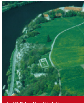
Luftbild mit mittelalterlichem Steingebäude.