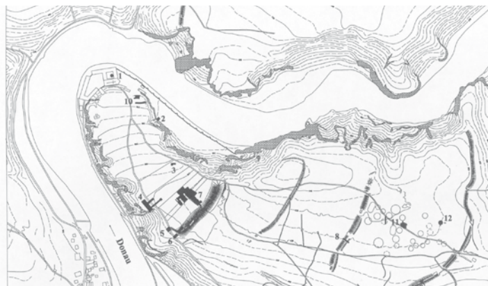
Topographischer Plan des Frauenberges mit Abschnittswällen und Grabungsflächen.

Das Kloster Weltenburg im so genannten Donaudurchbruch ist Touristen wegen der berühmten barocken Asamkirche und des Klosterbiers ein Begriff. Nur wenigen ist die geschichtsträchtige Bedeutung des Frauenbergs oberhalb des Klosters als vorgeschichtliche befestigte Höhensiedlung und bischöflicher Sitz bekannt.