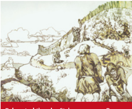
Rekonstruktion der Steinmauer vom Regensburger Künstler Günter Klobouk