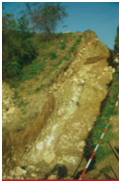
Wallschnitt von 1994